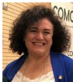
Ponente. Mª Concepción Villafañez García Presidenta del COM de Ciudad Real