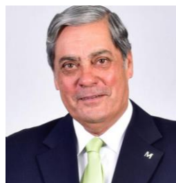
Ponente. Pedro Cabrera Navarro Presidente del COM de Las Palmas